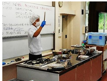
すり身を棒に巻き付ける