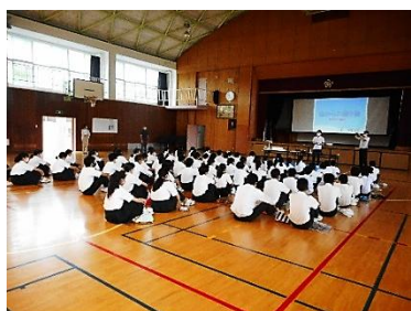
講話「海からの贈り物」