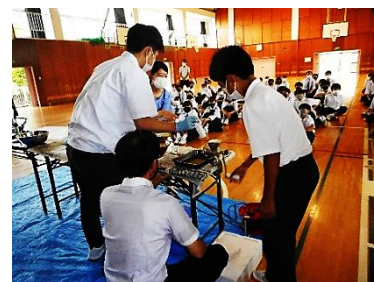
ミートチョッパー体験