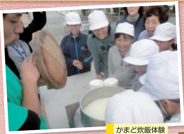
かまど炊飯体験をしたよ