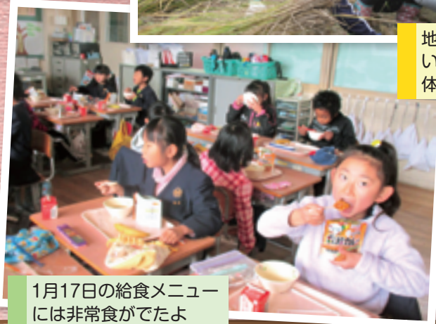
1月17日の給食メニューには非常食がでたよ