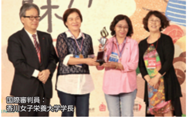
國際審判員： 香川女子營養大學學長