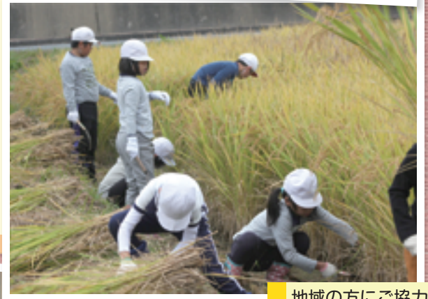
地域の方にご協力いただき稲刈り体験をしたよ