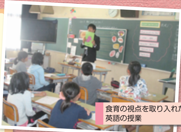
食育の視点を取り入れた英語の授業

そこで本校では、学校教育活動全体を通じて、食育に関する意識を高め、食の持つ多様な側面に気づき、食の大切さを学び、実践できる子を育てていきたいと考えました。そのためにまず、児童の実態と発達段階を踏まえて、全教科で食育の視点を持った授業づくりを実践することにしました。また、給食の時間や関連する教科等において食に関する指導内容の充実を図り、地域の田での稲刈り体験や、校区内にある農園での旬の作物の収穫体験などの機会も設けています。これらの活動を通して、児童が自分の食を見直し、主体的に課題を見つけ、解決していく態度の育成に向けて、学校全体で取り組んでいます。