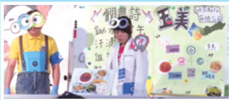
5分間の発表で、工夫を凝らした内容です。