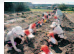
福崎町で設置されている学校給食園