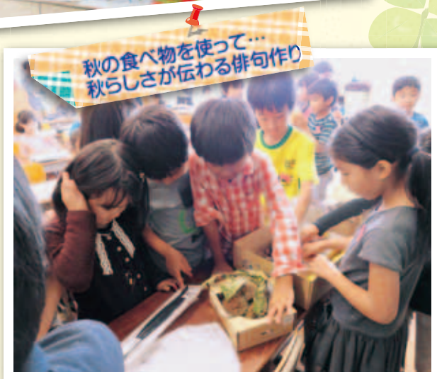
秋の食べ物を使って... 秋らしさが伝わる俳句作り

学校給食を生きた教材として積極的に活用し、食育実践を各学年における教科学習等に位置付けることで“持続可能な食育”を進めています。