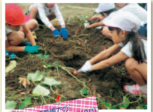
学校菜園での さつまいも掘り (10月)