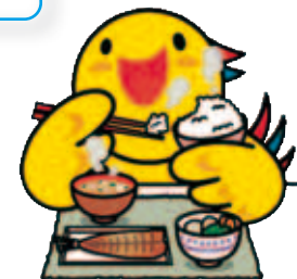
兵庫県マスコット「はばタン」