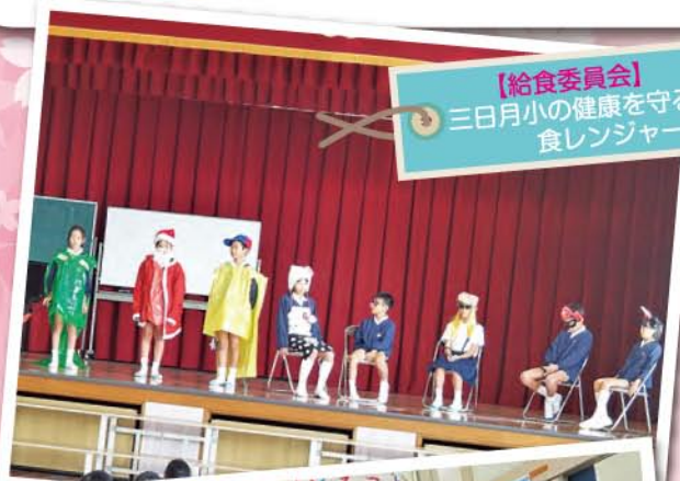
【給食委員会】 三日月小の健康を守る食レンジャー