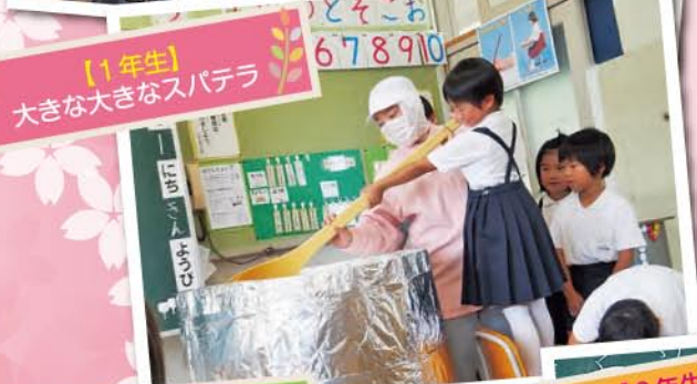
【1年生】 大きな大きなスバテラ