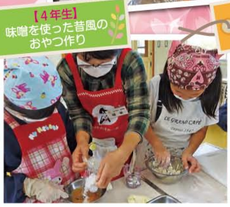
【4年生】 味噌を使った昔風のおやつ作り